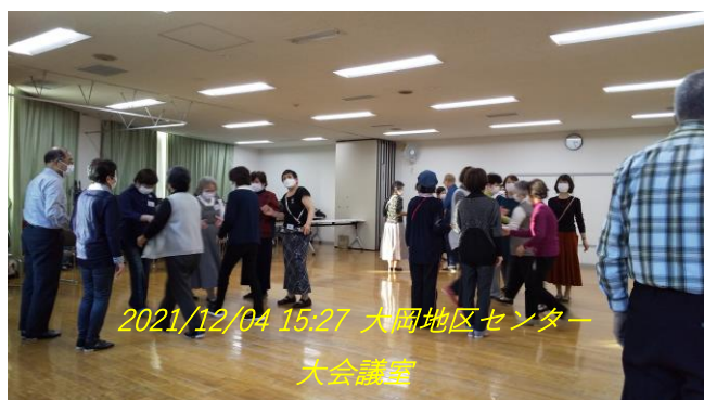
2021/12/04 15:27 大岡地区センター 大会議室