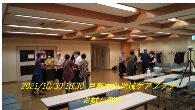
2021/10/30 18:30 戸部本町地域ケアプラザ ・お試し例会